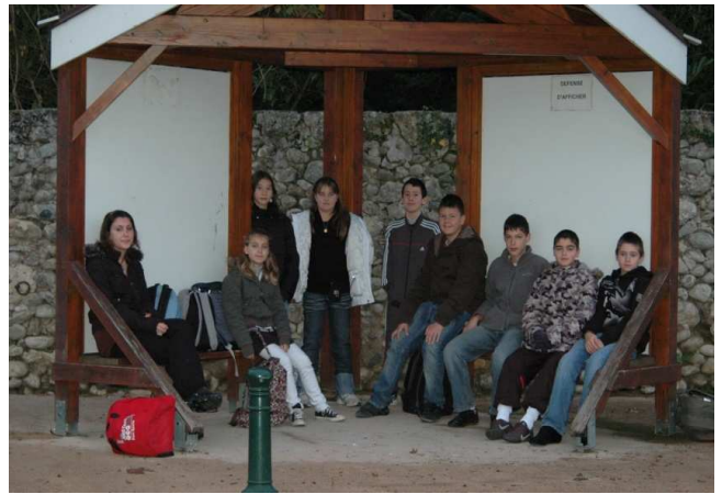
Départ pour le collège de Vinay

A tous nous souhaitons une bonne année scolaire.