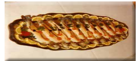
Spécialité de truites en gelée

2. L'Isère au tout début de la deuxième guerre mondiale, sera en zone libre pour être ensuite occupée en 1942 dans un premier temps par les troupes italiennes puis en 1943 par les troupes allemandes.