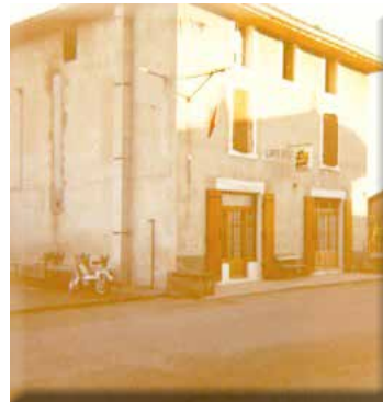
Le Cath-Lou en 1979