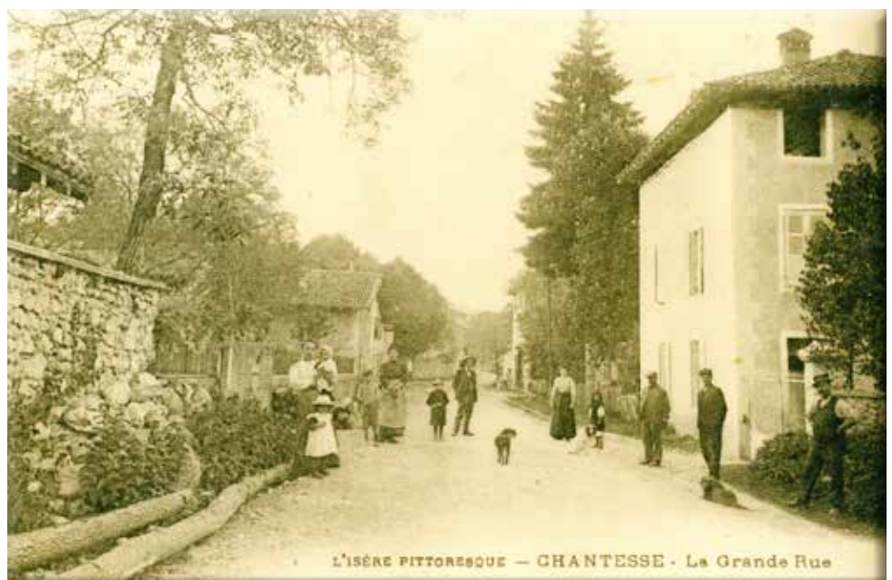
L'ISÈRE PITTORESQUE — CHANTESSE - La Grande Rue