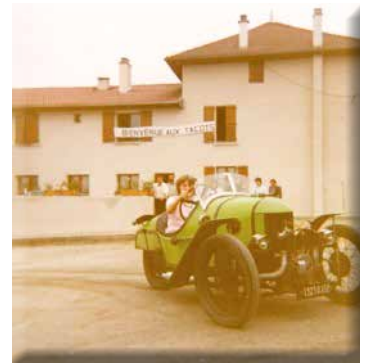
Le rallye surprise en 1980