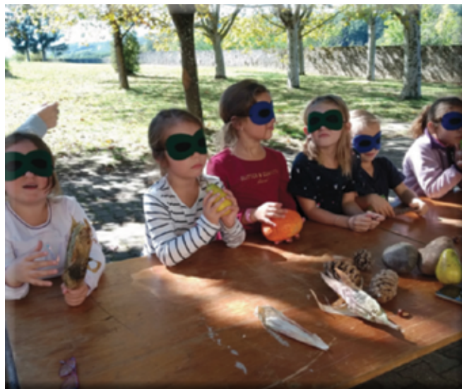
Blind test sur les légumes pour les élèves

La semaine du goût qui se déroule au jardin pédagogique « Bon Rencontre » de Notre Dame de L'Osier remporte un franc succès cette année ! Tous les créneaux d'ateliers sont déjà réservés par les écoles, nous avons même ouvert une demi-journée supplémentaire le vendredi pour l'école de Colombe. La semaine du goût aura donc lieu cette année