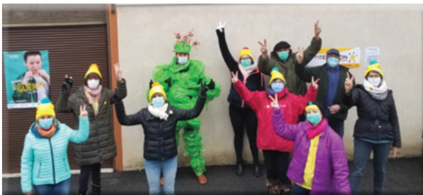
L'association Colibris lors du dernier Téléthon