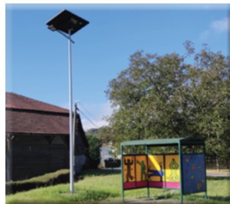
Abribus et candélabre solaire